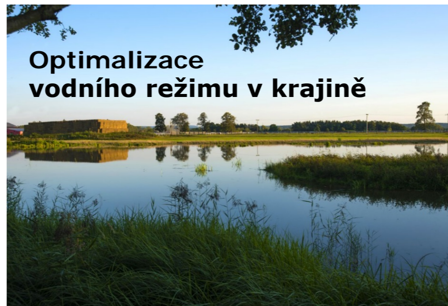
Optimalizace vodního režimu v krajině