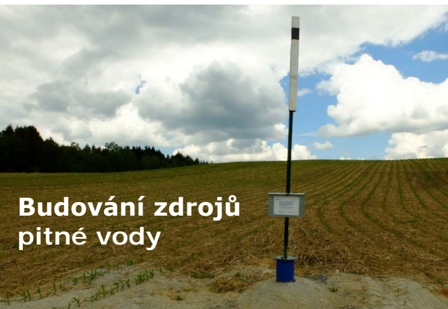
Budování zdrojů pitné vody