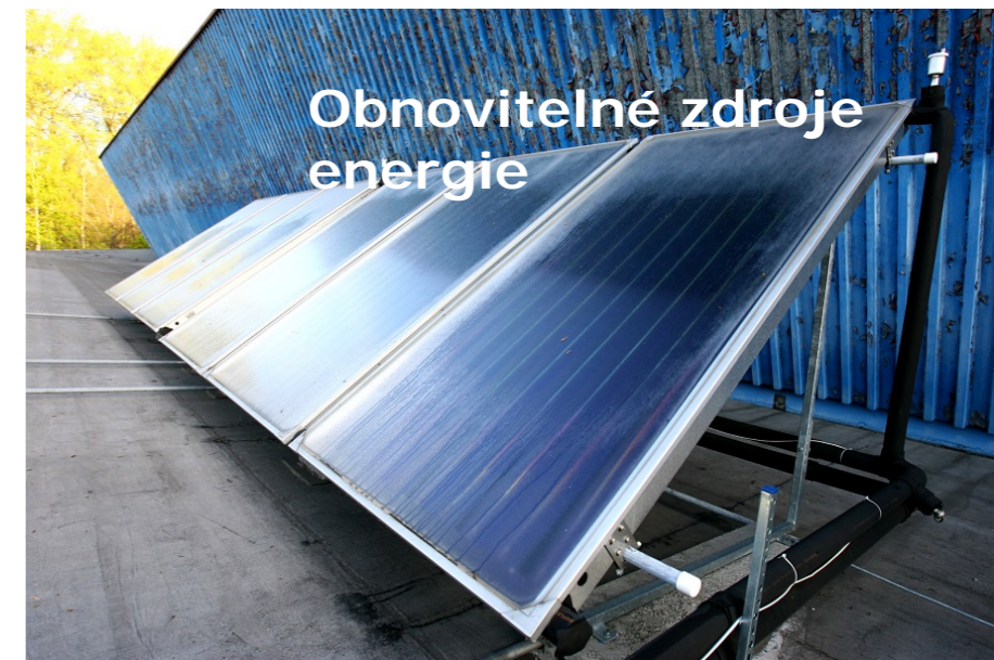
Obnovitelné zdroje energie