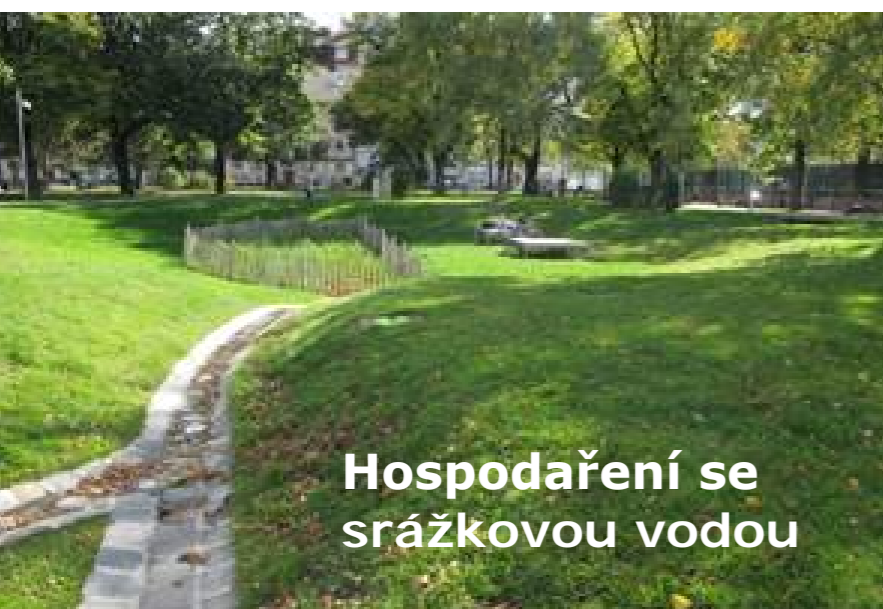
Hospodaření se srážkovou vodou