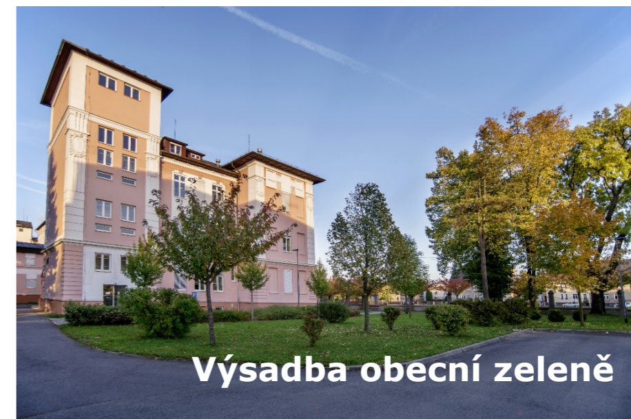
Výsadba obecní zeleně