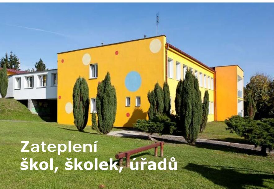
Zateplení škol, školek, úřadů