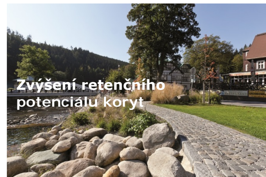
Zvýšení retenčního potenciálu koryt