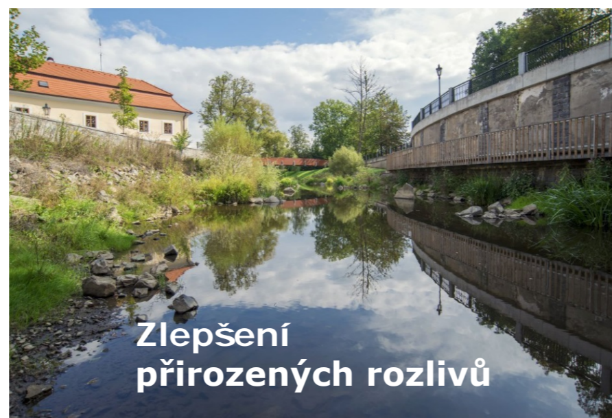
Zlepšení přirozených rozlivů